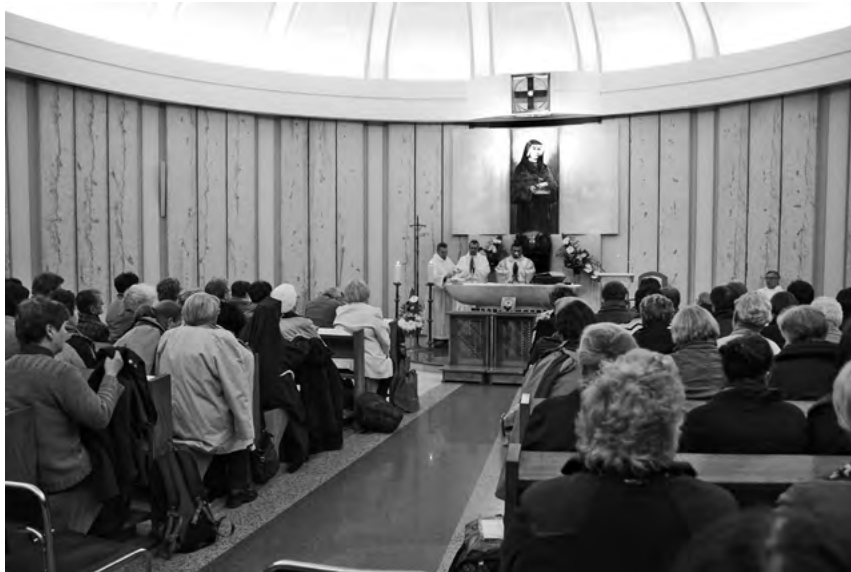
Jubileusz - Eucharystia